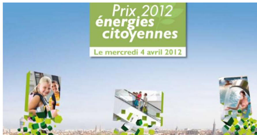
Évènements au Palais d'Iéna

Actualités et agendas > Actualités > « Prix Energies Citoyennes » - 4 avril