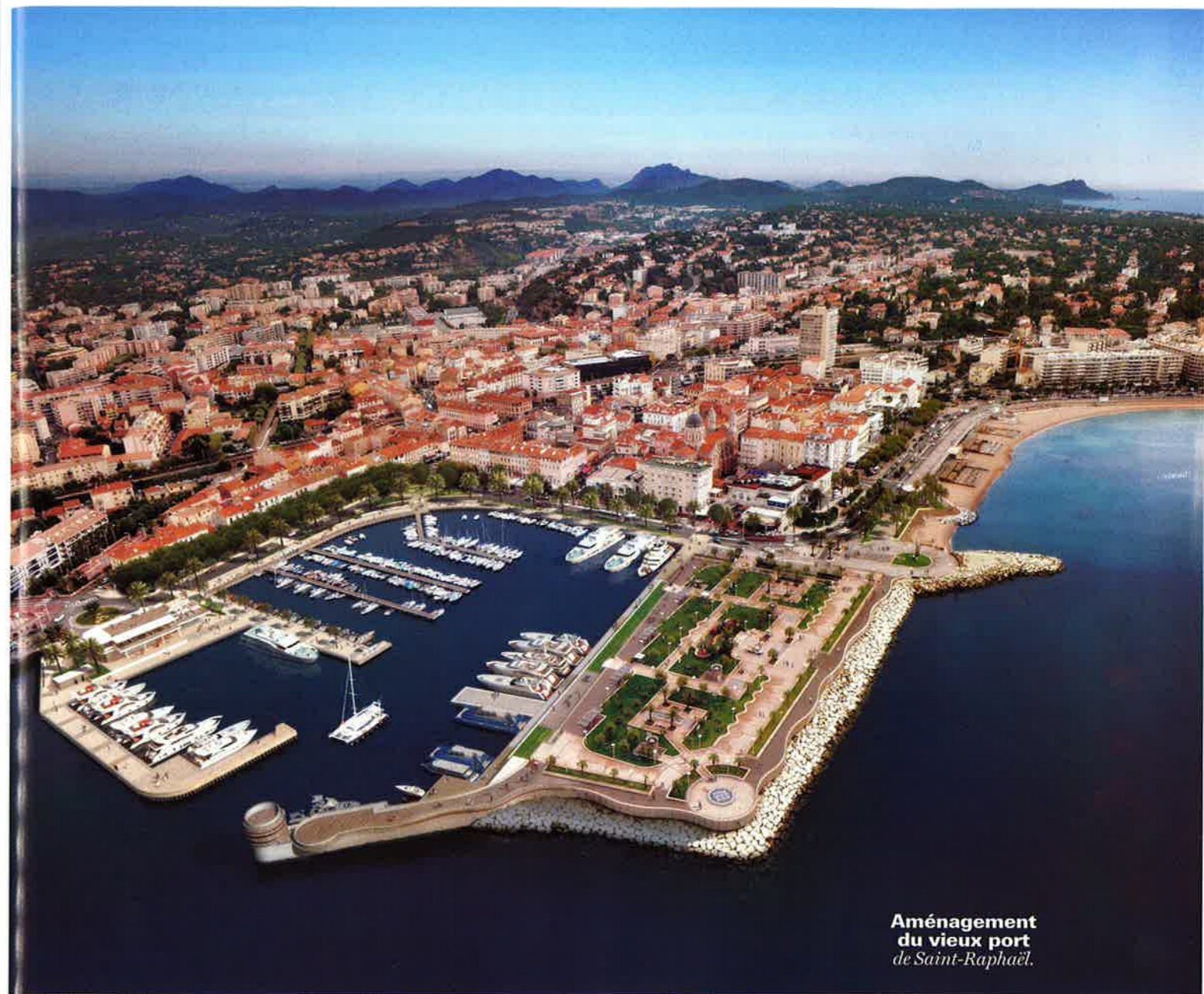
Aménagement du vieux port de Saint-Raphaël.

« Après analyse, l'appel à un PPP était préférable, en termes de coût global et de nature des risques. »