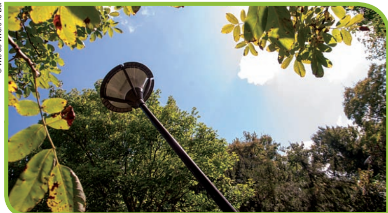
Dans le parc d'Astanières, des lampes LED ont été installées.

La performance énergétique des bâtiments est aussi une préoccupation de la commune. En témoigne la construction, en 2008, de l'école Louis Jouvot. Chauffage géothermique par puits, toiture végétalisée, orientation intelligente... Ce bâtiment offre une performance équivalente à celle du label BBC.