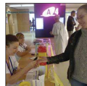
Une femme se fait dépister par une aide-soignante.

Deux types de dépistage existent : celui de type 1 survient en général durant « la petite enfance, l'enfance, l'adolescence », et celui de type 2 apparaît, « à partir de 40 ans en moyenne », souligne l'infirmière. « Le dépistage doit une fois par an, auprès de son médecin traitant. » Le médecin traitant et le service de diabétologie travaillent