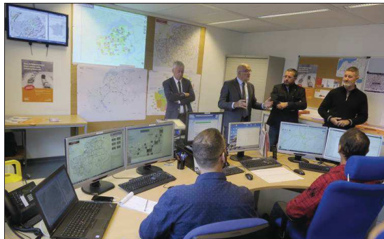
La salle d'exploitation routière (Salex) du Département est le centre névralgique du dispositif. Sa mission est de collecter les informations liées aux événements survenant sur le réseau, coordonner les actions sur le terrain et informer les usagers des perturbations en cours, via les panneaux lumineux et le site internet inforuote74.fr. En 2017, les agents de la Salex ont traité 6 326 alertes et transmis 1 639 messages.