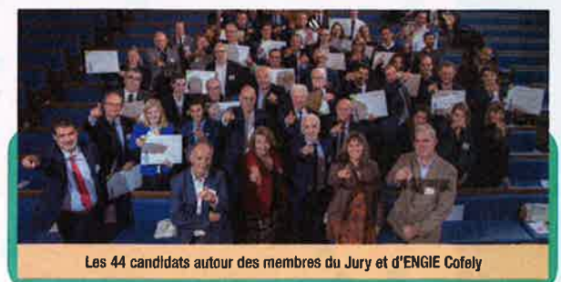
Les 44 candidats autour des membres du Jury et d'ENGIE Cofely